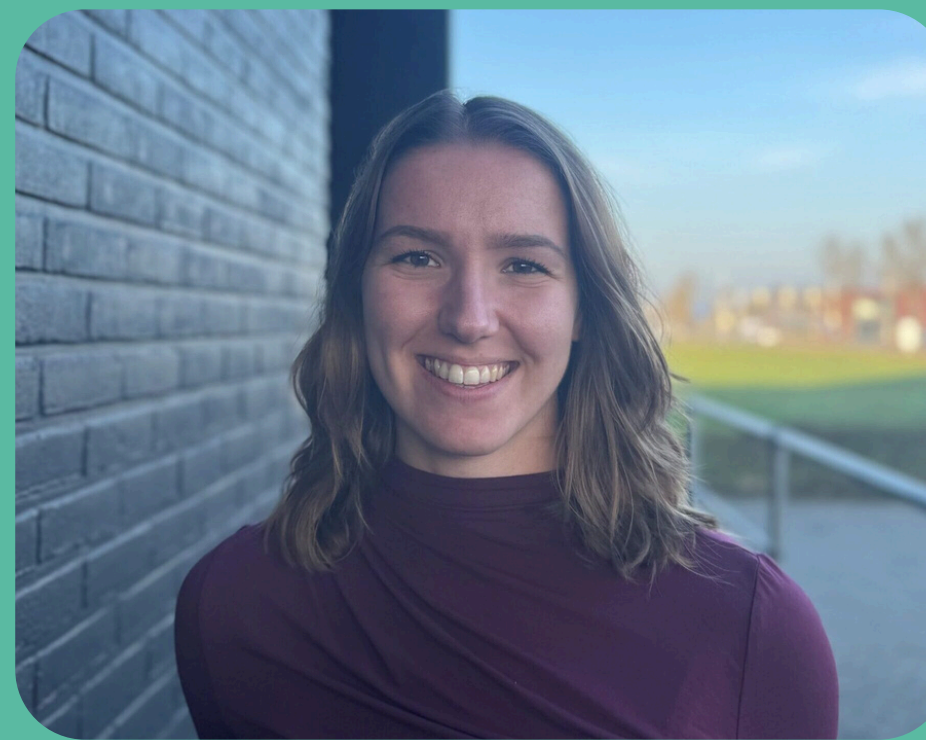
Communicatiemedewerker en projectondersteuner