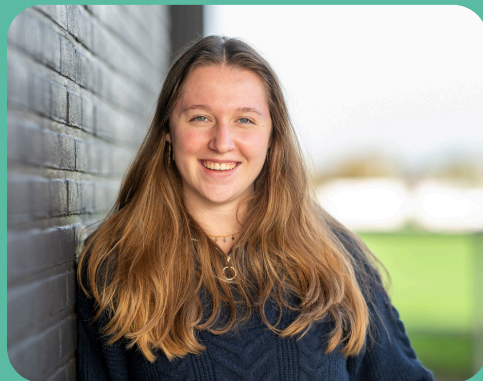
Projectleider Moi Drenthe